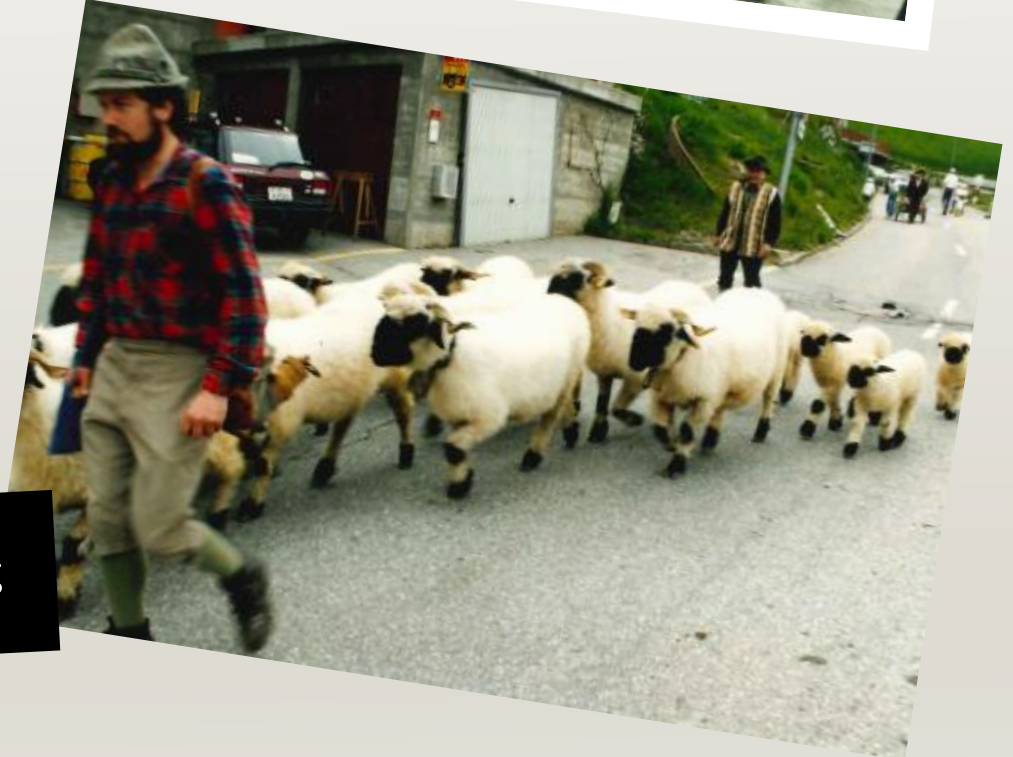
Der grosse Umzug